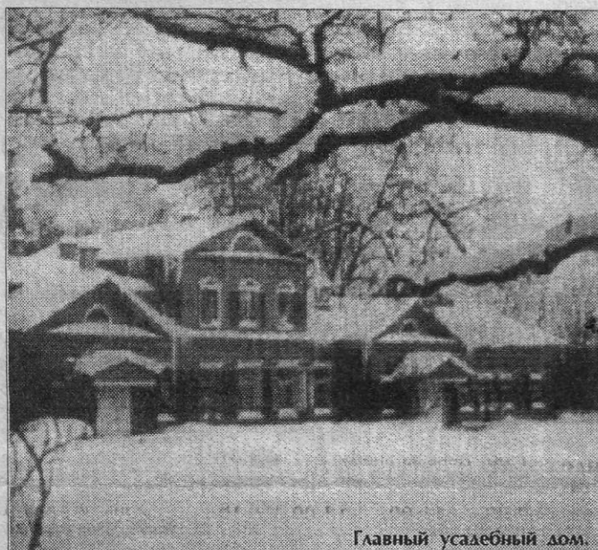
Главный усадебный дом.

(Продолжение. Первая часть воспоминаний под названием "Лето в Абрамцево" опубликована в "Краеведческом вестнике" № 7 (45), газета "Вперед" от 6 августа 1998 года.)